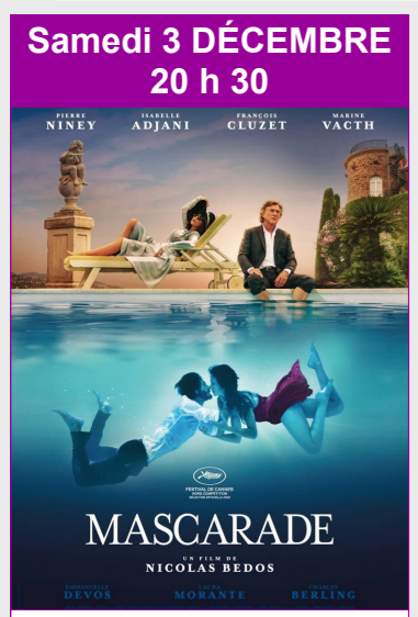
Mascarade De Nicolas Bedos Durée : 2h14 Genre : Comédie dramatique