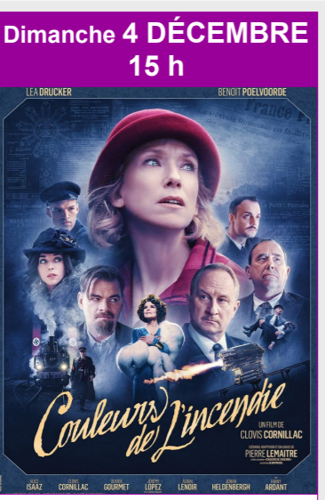
Couleurs de l'incendie De Clovis Cornillac Durée : 2h16 Genre : Historique, Drame