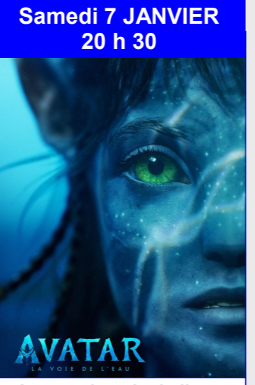
Avatar : la voie de l'eau De James Cameron Durée : 3h10 Genre : Science fiction, Aventure