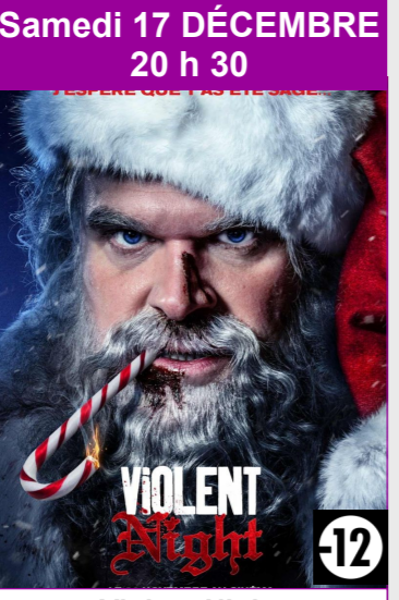
Violent Night De Tommy Wirkola Durée : 1h51 Genre : Action, Thriller