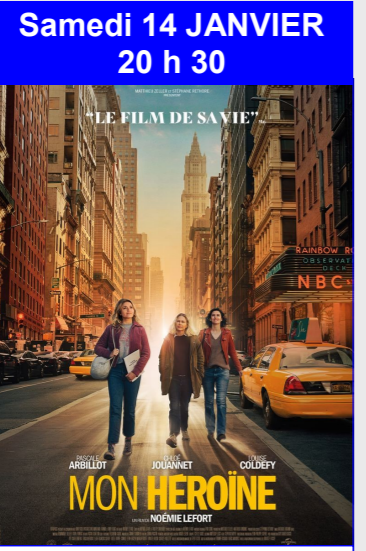
Mon héroïne De Noémie Lefort Durée : 1h48 Genre : Comédie