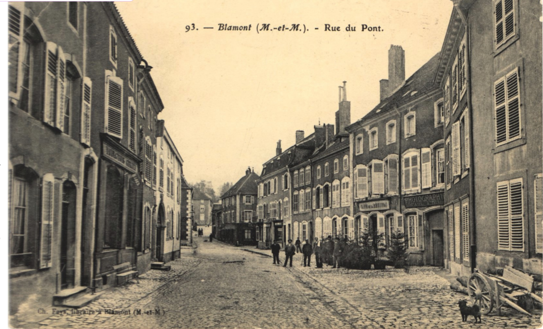
93. — Blâmont (M.-et-M.). - Rue du Pont.

Cette vue de la rue du Pont présente en son milieu le « Café de la Réunion » avant 1910, dans le fond la rue du Château, et à gauche les immeubles détruits pendant la seconde guerre mondiale pour former la place du Général de Gaulle. Il est tenu à l'époque par Paul Auguste Fiel, qui y adjoint une activité de photographies. Si le café n'a jamais changé de nom, il aura cependant, en un siècle, changé pour un immeuble moderne (avec extension en largeur vers la droite), d'adresse (rue du Pont, puis du Maréchal Foch en 1929, place de Vézelize en 1945, et place du Général de Gaulle en 1970) et de propriétaires