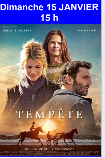
Tempête De Christian Duguay Durée : 1h50 Genre : Comédie, Famille