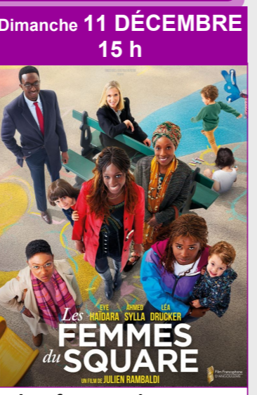
Les femmes du square De Julien Rambaldi Durée : 1h45 Genre : Comédie