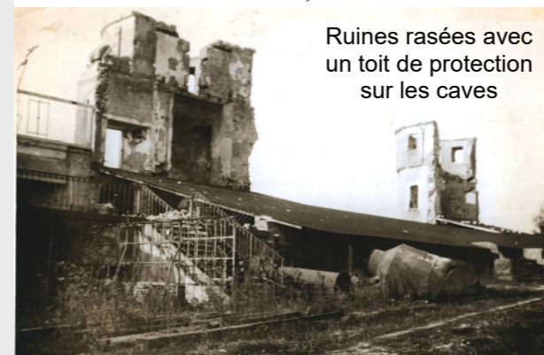
Ruines rasées avec un toit de protection sur les caves