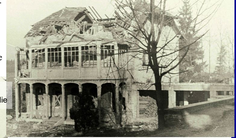
1944 Après l'incendie