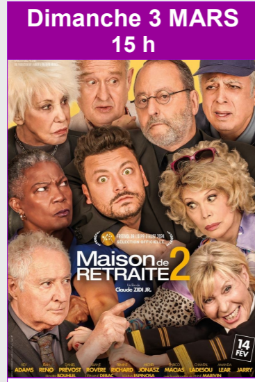
Maison de Retraite 2 De Claude Zidi Jr. Durée : 1h42 Comédie