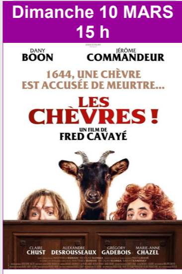
Les Chèvres De Fred Cavay, Durée : 1h40 Comédie