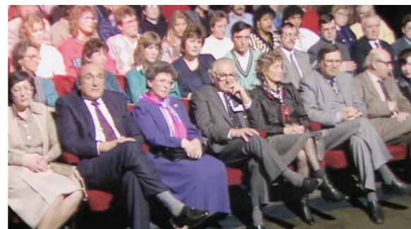
Émission BBC That's life - 1988 - Nicholas Winton, au centre, ignore encore que les autres spectateurs sont ses anciens protégés.

Les bénévoles du cinéma Bon Accueil ont sélectionné pour vous le magnifique film « Une Vie » tiré d'une histoire vraie de 1938 où, à Prague, le banquier londonien Nicholas Winton (1909-2015) va tout mettre en œuvre pour sauver des centaines d'enfants, promis à une mort certaine dans les camps de concentration. Cet épisode, méconnu pendant des décennies, est dévoilé en 1988, lors d'une émission britannique à laquelle Winton est invité pour témoigner, sans qu'il ne se doute que dans le public se trouvent des enfants, désormais adultes, qui font partie des 669 qui ont survécu grâce à lui.