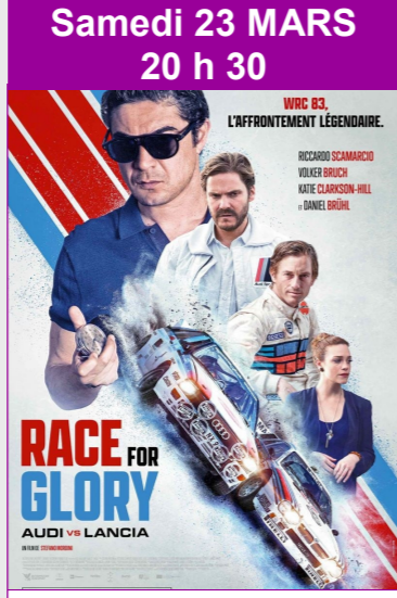
Race for Glory : Audi vs Lancia De Stefano Mordini Durée : 1h33 Biopic, Drame