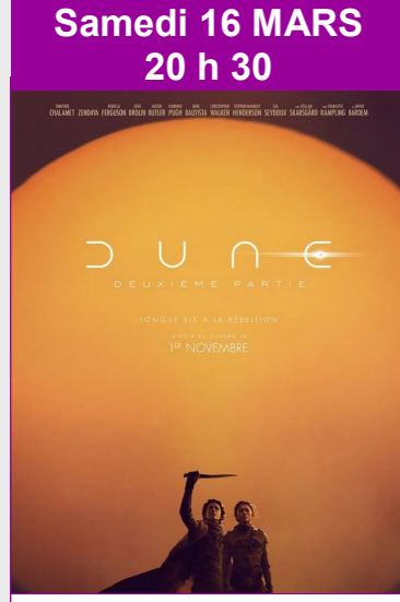
Dune : deuxième partie De Denis Villeneuve Durée : 2h46 Drame, Science Fiction