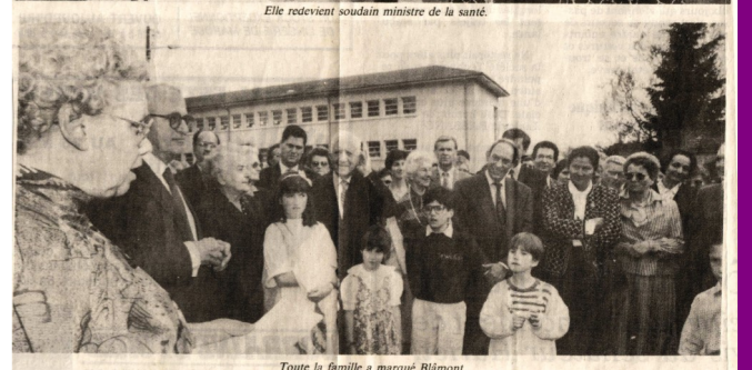
Toute la famille a marqué Blâmont.

Est-Républicain - mai 1991 « Retour à Blâmont pour les Veil »