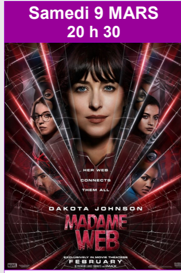
Madame Web De S.J. Clarkson Durée : 1h55 Action, Fantastique