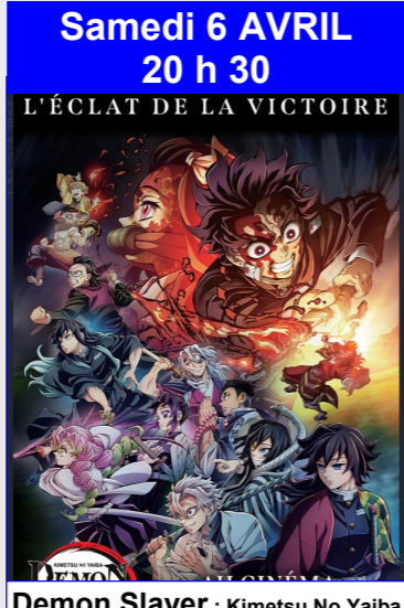
Demon Slayer : Kimetsu No Yaiba - En route vers l'entraînement des piliers De Haruo Sotozaki Durée : 1h44 Action, Animation, Fantastique