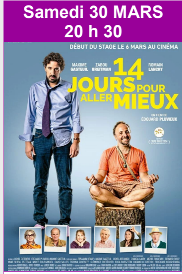
14 jours pour aller mieux De Edouard Pluvieux Durée : 1h30 Comédie