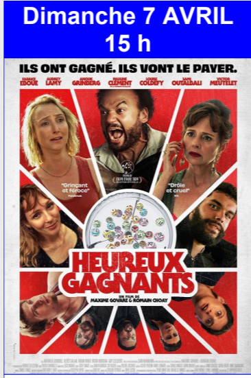
Heureux gagnants De Maxime Govare, Romain Choay Durée : 1h32 Comédie