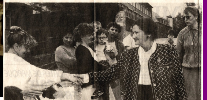
Elle reçoit soudain ministre de la santé.

Le 21 novembre 1990 la commune confirme la décision de nommer « Place Bechmann » ce parking désormais créé, avec une inauguration officielle le 25 mai 1991, en présence de Simone et Antoine Veil.